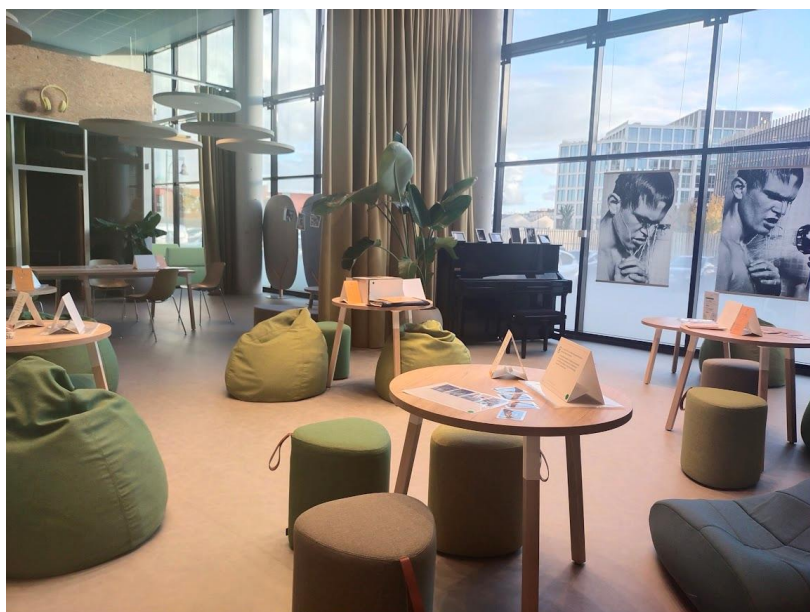
La Maison de l'autisme